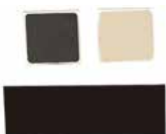
テストプレート (ダメージスレッシュホールド確認用)